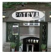
Open Mic POTRVÁ #45 1. 6. 2011