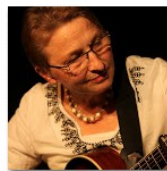
Open Mic POTRVÁ #44 4. 5. 2011