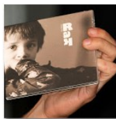
Open Mic POTRVÁ #46 7. 9. 2011