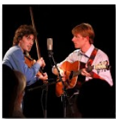
Open Mic POTRVÁ #47 5. 10. 2011